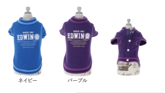
ネイビー パープル

スタジャン風デザインを柔らかなスウェットで作りました。動きやすく元気なイメージのウェアです。