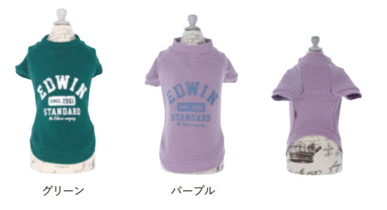
グリーン パープル

シンプルなスウェットにダメージ加工を施したロゴをデザインし、ユーズド感を出したウェアです。