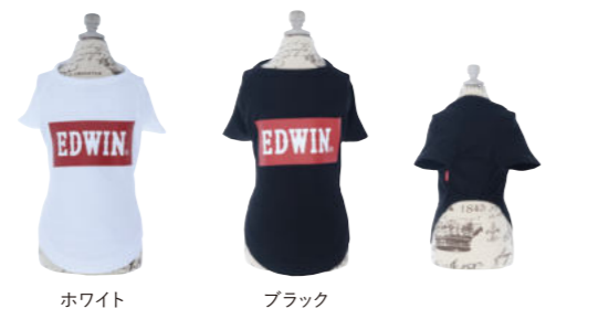
ホワイト ブラック

EDWINのロゴを大きくデザインしたいつの時代も変わらない、僕らの定番であるEDWINを表現したウェアです。